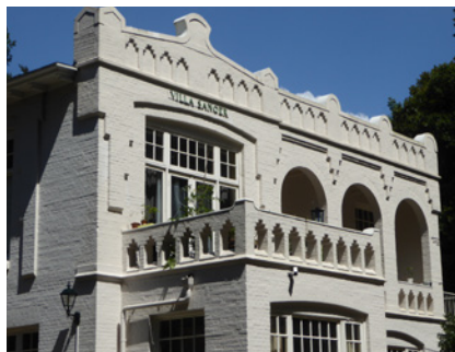
Villa Sanoer, Geertjesweg

Dompel uzelf onder in Indische sferen... en ontdek de verschillende sporen aan de hand sfeervolle oude foto's, landkaarten, kleurige schoolkaarten, dromerige schilderijen, kunstvoorwerpen, fraai geïllustreerde boeken en andere voorbeelden van