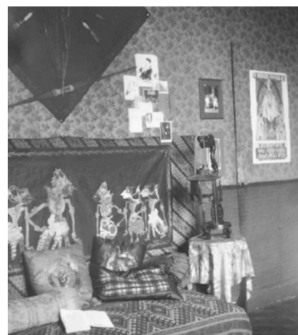
Indische studentenkamer 1928

Na de Tweede Wereldoorlog krijgt Wageningen te maken met de repatriëring van Indische gezinnen en