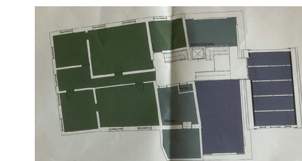
Figuur 2: Eerste verdieping na verbouwing.

Legenda vlekkenplan entree exposities gesloten voor publiek HVOW kunstexpositie multifunctie multifunctie tijdelijk