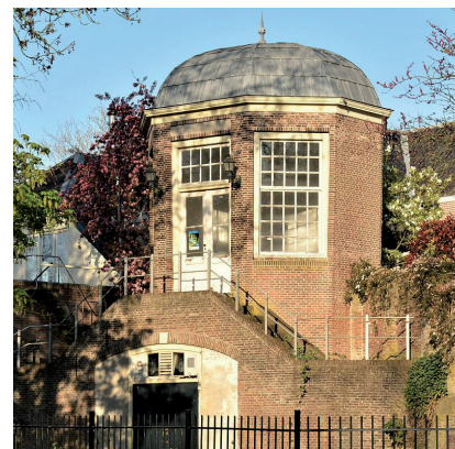
De Theekoepel aan het Wallenpad op een oude vestingstoren in de omgeving van het museum.

Als voorbereiding op de herinrichting moeten we een lijst samenstellen van