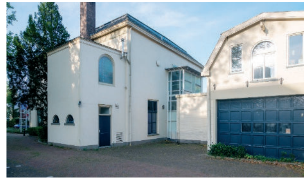
De nieuwe Zomerzaal komt tussen de villa en het Koetshuis in.

Maar ook een vernieuwd museum met meer 'ruimte' in de breedste zin van het woord: ruimte voor verscheidenheid, flexibiliteit en gastvrijheid. Met de nieuwe multifunctionele Zomerzaal ontstaat een museum waar verhalen, exposities en ontmoetingen samenkomen – een museum dat leeft en verbindt.