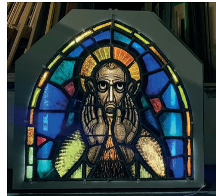
Roepende man. De afbeelding past in het thema "door Maria tot Jezus". 90 x 90 cm.