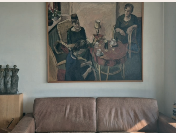
Kunst boven de bank ergens in Wageningen.

In Museum de Casteelse Poort is vanaf 27 november de expositie 'Kunst uit Huis' te zien. In opzet lijkt het sterk op de expositie die Tom Mercur 50 jaar geleden in zijn museum in Franeker organiseerde. Ook in Wageningen worden burgers gevraagd één of meer (maximaal drie) kunstvoorwerpen in bruikleen aan het museum te geven om daar te worden tentoongesteld. Niet om daarmee bezoekers naar het museum te lokken, maar om anderen te laten zien welke kunst thuis gekoesterd wordt. Deze opzet is -met een knipoog naar het populaire Openbaar Kunstbezit uit de periode 1957 tot 1965- een manier om privébezit van kunst te 'openbaren'. En zo toegankelijk te maken voor anderen.